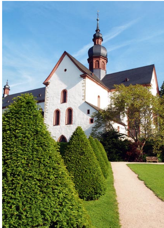
Mit eindrucksvollen Bauten vor allem aus dem 12. bis 14. Jahrhundert ist das Kloster Eberbach das bedeutendste mittelalterliche Gesamtkunstwerk in Hessen

Wir treffen uns um 18.00 Uhr im Vestibül des Mönchsrefektoriums und beginnen den Abend mit einer Schlenderweinprobe. Sinnlicher als bei dieser Führung kann man die seit den Zeiten der Zisterzienser in Eberbach gepflegte Kunst des Weinbaus kaum erfahren. Auf den Spuren der Eberbacher Mönche schlendern Sie durch das Kloster. Das stimmungsvolle Hospital, der historische Cabinet-Keller, der elegante hochgotische Kapitelsaal, das ausdrucksstarke kreuzgewölbte Dormitorium, das festliche barocke Refektorium und die monumentale romanische Klosterkirche liegen dabei auf Ihrem Weg. Unterwegs werden Ihnen sechs erlesene Weine ausgeschenkt. Von Raum zu Raum wechseln die passend auf deren Raumeindruck abgestimmten Weine und wächst zugleich Ihre Kenntnis über das monastische Leben früherer Jahrhunderte. Den Abschluss findet die Führung mit Gesängen in der Basilika, dargeboten vom Mixtour Vocalquartett .